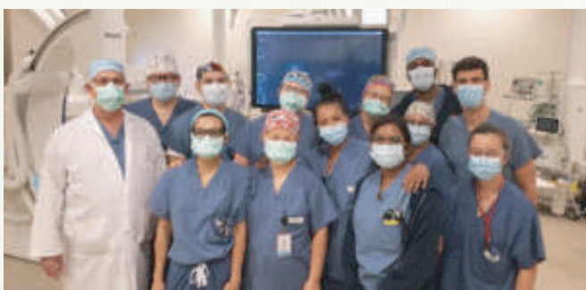
Équipe du laboratoire de cathétérisme cardiaque de l'HGJ.

Acquis cet automne, l'équipement à la fine pointe de la technologie rend l'angioplastie pulmonaire par ballonnet une solution viable pour les patients qui autrement n'auraient pas été retenus comme candidats pour cette intervention.